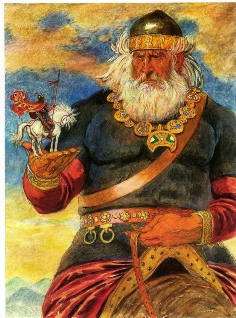
• СВЯТОГОР •