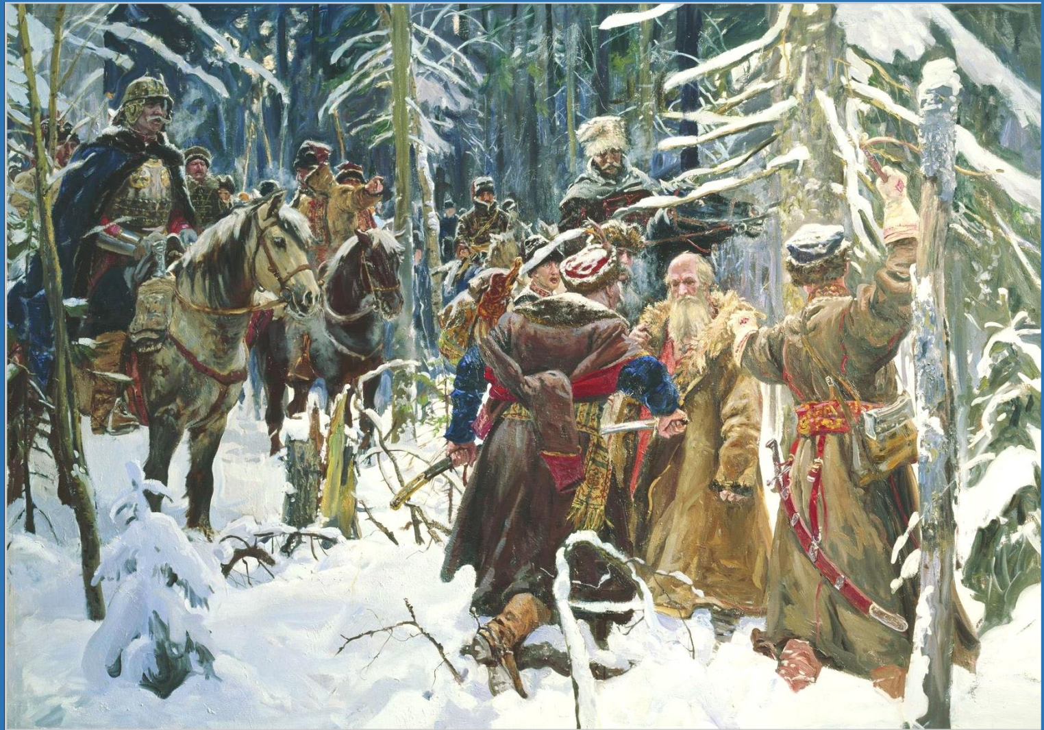
Фаюстов М.В. "Иван Сусанин" 2002