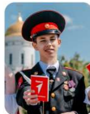
«МЫ – ГРАЖДАНЕ РОССИИ!»