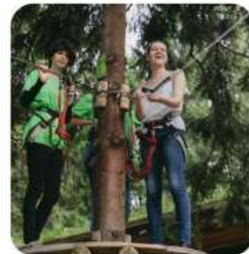
«ПОХОДЫ ПЕРВЫХ- БОЛЬШЕ, ЧЕМ ПУТЕШЕСТВИЕ»