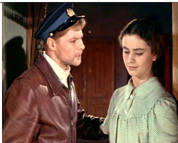
Кадр из фильма 1955 года

Первый художественный фильм по роману снят в 1955 году на киностудии «Ленфильм» режиссером В. Венгеровым; в ролях: А. Михайлов, О. Заботкина, А. Адоскин, Е. Лебедев и др. В 1976 году был снят шестисерийный приключенческий фильм по роману (режиссер Е. Карелов; в главных ролях: Б. Токарев, Е. Прудникова, Ю. Богатырев).