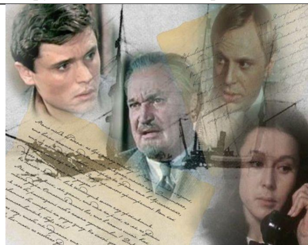
Коллаж к фильму 1976 года